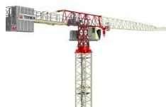
GME (cat 1)