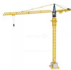
GME (cat 1)