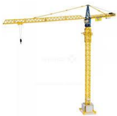
GME (cat 1)